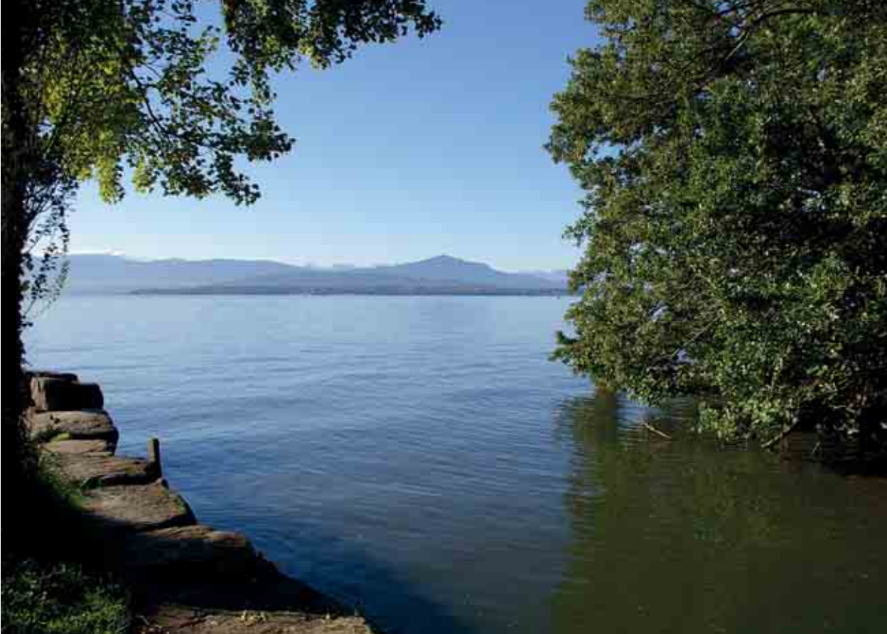
L'affluent de la Dullive rejoint le Léman.

du fait de l'emplacement du château de Bursins et d'autres maisons de nobles. Cette rivière marquait alors la frontière entre les terres du prieuré de Romainmôtier et la baronnie de Prangins.