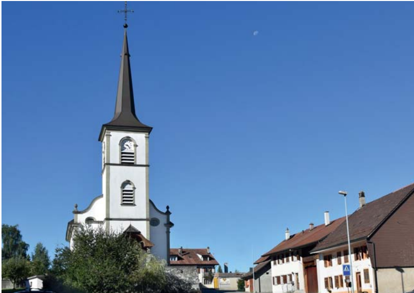
Le petit village de Villarimboud.

Cet ouvrage est avant tout une promenade dans ce pays de Glâne, nous offrant des paysages de quiétude qui sont une pure invitation à la sérénité. Celle qui apaise le cœur et l'âme. Des paysages habités par un peuple avec son histoire de vie, ses traditions et qui méritent donc attention et respect.