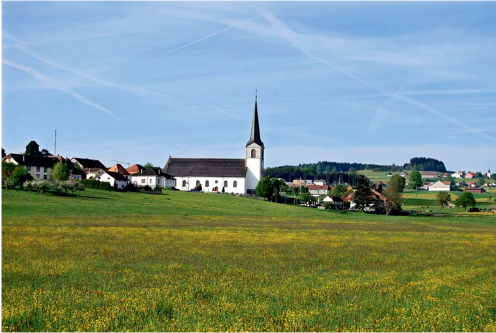
Vuisternens-devant-Romont au milieu de ses prairies printanières.

Puis remontant vers l'est du district, nous apercevons les villages de La Joux, Sommentier et Vuisternens-devant-Romont. En contrebas se trouve Villaraboud et de l'autre côté du vallon, Siviriez. Plus loin à l'orée de Romont, se situe Billens avec son hôpital et sa blanche église. Nous prenons ensuite un peu d'altitude pour nous rendre à Grangettes et au Châtelard. Ce sont des villages typiquement ruraux à grands espaces de champs et pâturages broutés par d'imposants troupeaux de vaches, sans compter les prairies réservées pour la fenaison en vue de l'hiver. Pour la plupart, ils nous offrent, au levant, un décor de carte postale avec la chaîne des Préalpes.