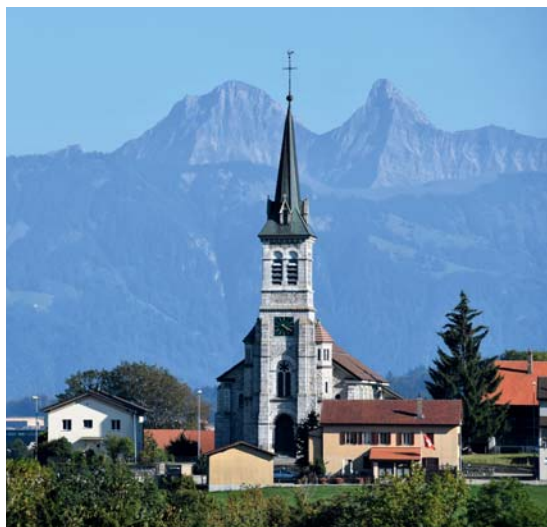
Le village de La Joux cadré des montagnes de la Gruyère.

Aux alentours, on découvre une paisible campagne plus tournée vers le midi, avec en arrière-fond la merveilleuse chaîne des Alpes, comme revêtue d'un voile d'ombre bleue laissant pressentir la présence du Léman. Au milieu des champs ou à l'orée de quelques forêts, plusieurs villages nous offrent leur charme avec leurs lieux de rencontre sociale que sont leurs restaurants, sans oublier leurs sanctuaires. Véritables havres de paix et de quiétude, nous plongeant dans une belle lumière du vitrail d'une beauté sans pareille. En ce sens, on peut évoquer les vitraux d'Ursy, Promasens, Chapelle-sur-Oron ou Morlens.