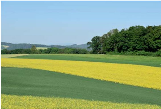
Le jaune fluorescent du colza en contrebas de Châtonnaye.

Venue des pays des chauds soleils, l'heureuse hirondelle dessine de vastes arabesques, invitant les ondes solaires printanières à caresser la campagne en attente de renaissance. Et nous voici déjà au cœur d'avril, avec le charme subtil des prairies qui miroitent de perles d'or, la fleur du pissenlit, puis les champs de colza jaune fluorescent apparaissent en damier au mois de mai. Dans les maigres prairies, joliment vêtues de leur robe blanche, les marguerites ondulent au souffle du vent.