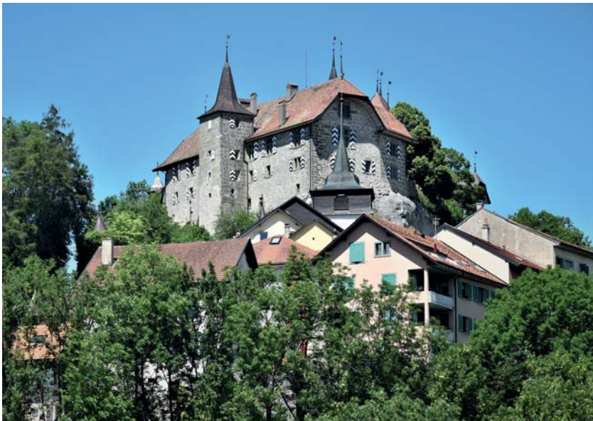
La cité de Rue dotée d'une longue histoire !

Par ses forêts, clairières et prairies, la Glâne s'habille d'un dégradé de verdure aux nuances chatoyantes qui rythment les saisons. Avec ses collines aux courbes harmonieuses, qui s'évanouissent dans les brumes de ses vallons, les paysages s'enveloppent d'une atmosphère de quiétude qui semble venue des grands ailleurs.