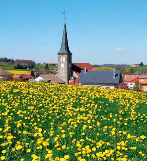
Siviriez dans les ors du printemps.