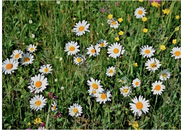
Mille yeux de lumière.